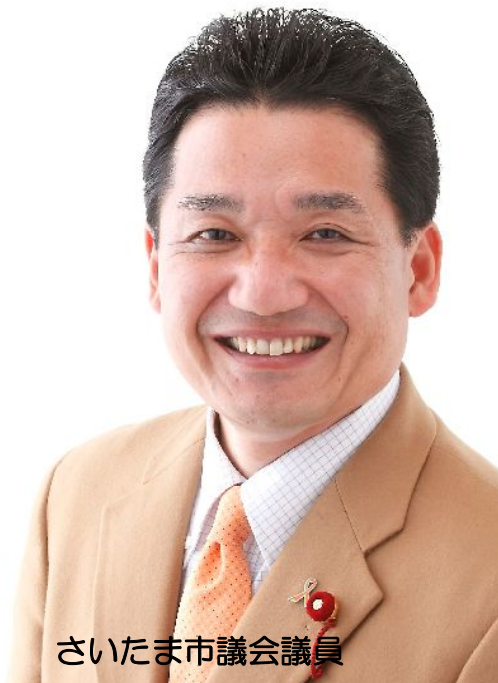
さいたま市議会議員